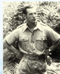
Ο Ρομπέρτο Λέμπολντ